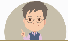
聚富爸爸 40歲 男性